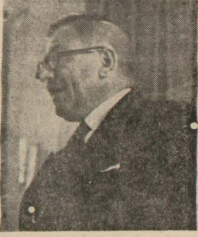
Profesör Hasan Reşit Tankut konferansını verirken

İlmin asla şaşmaz ölçüsile iddia ediyor ve kanaat getiriyoruz-ki Alevi nerede olursa olsun hangi dili konuşursa konuşsun daima Türktür